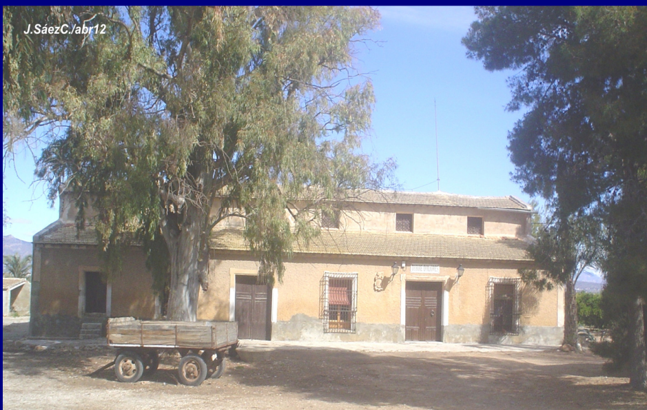
TORREDOLORES (Siglo XVII) en el Barrio de Santa Águeda de Catral