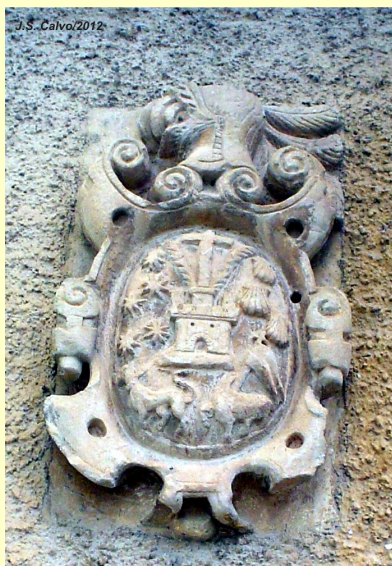
ESCUDO DE ARMAS DE TORREDOLORES, PROCEDENTE DE LA INQUISICIÓN ESPAÑOLA

Hechos, documentos, testimonios y certezas de cuanto pueda contribuir a conocer mejor nuestra historia como pueblo