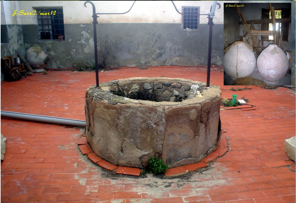
Patio con pozo de agua dulce; arriba, tinajas de aceite de la almazara