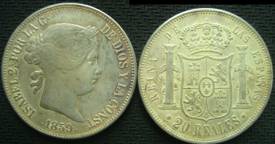
Moneda de 20 reales que circulaba en España en 1859