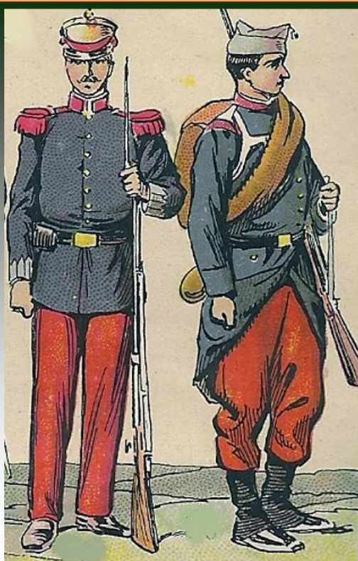
Milicia Nacional en Catral, 1855