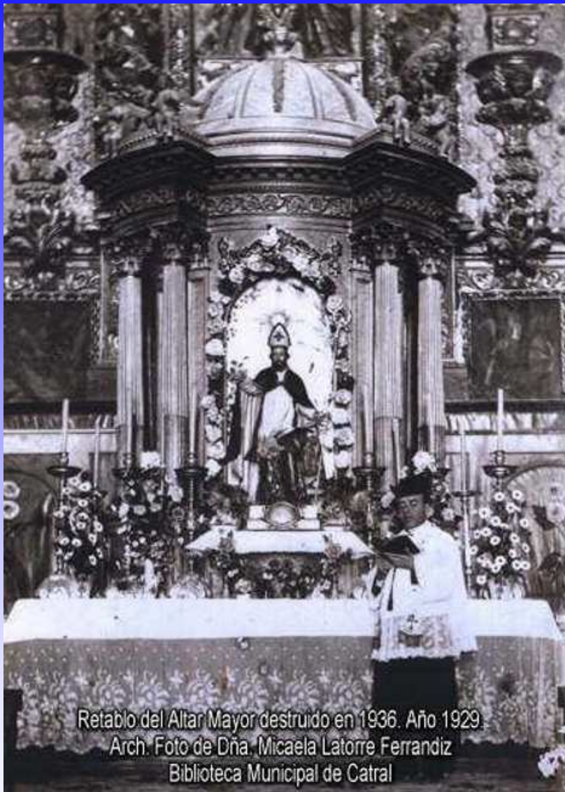
Retablo del Altar Mayor destruido en 1936. Año 1929.