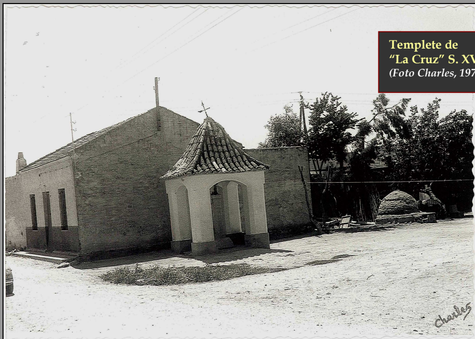
Templete de "La Cruz" S. XVII (Foto Charles, 1972)