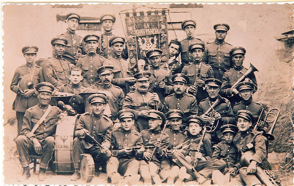
1923: "La Constancia" dirigida por José M. Miralles Quinto