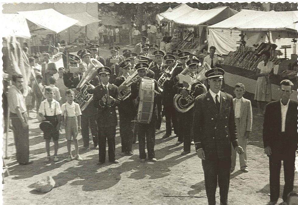
1953: "La Constancia" dirigida por Juan Miralles Leal